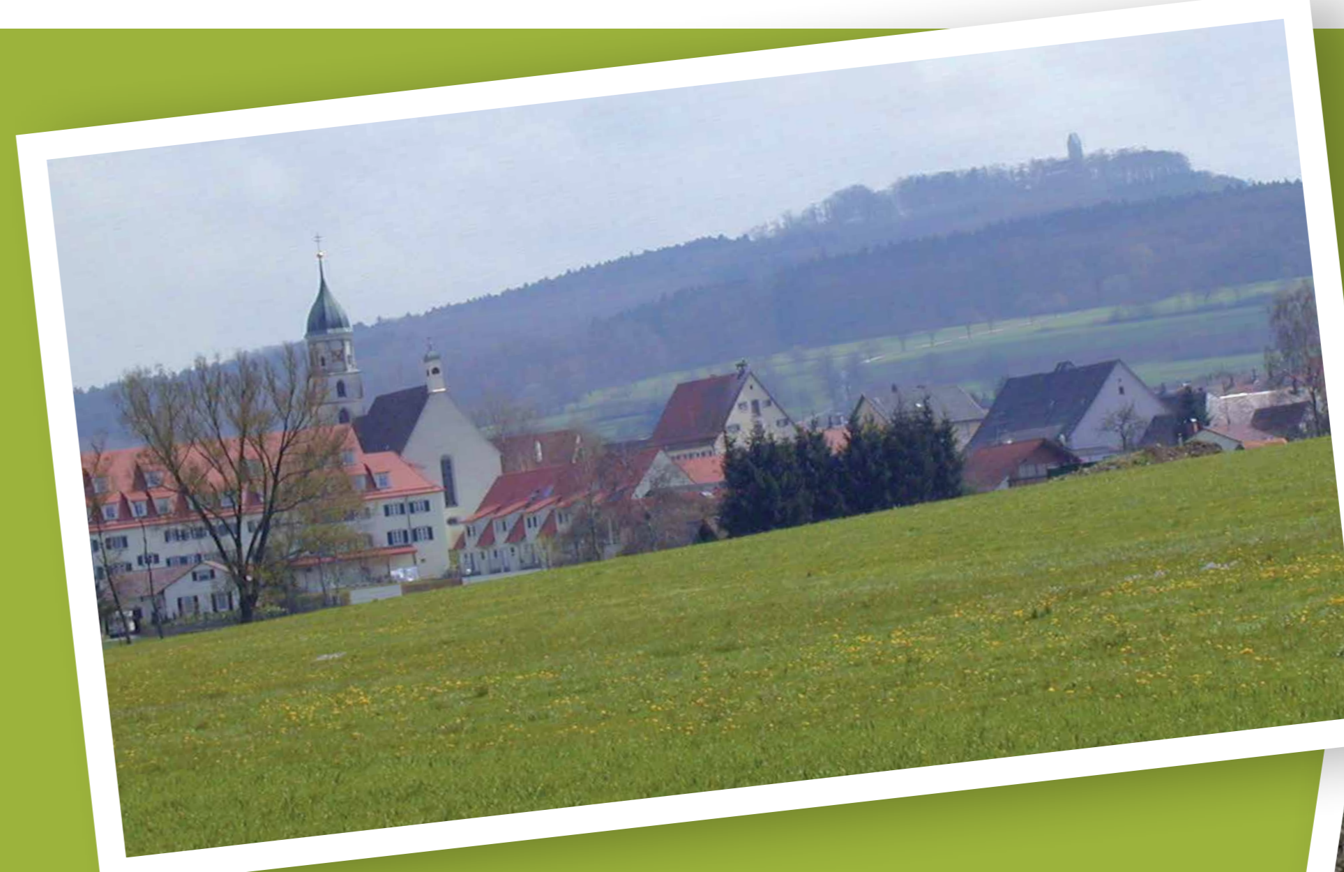
Blick auf den Bussen