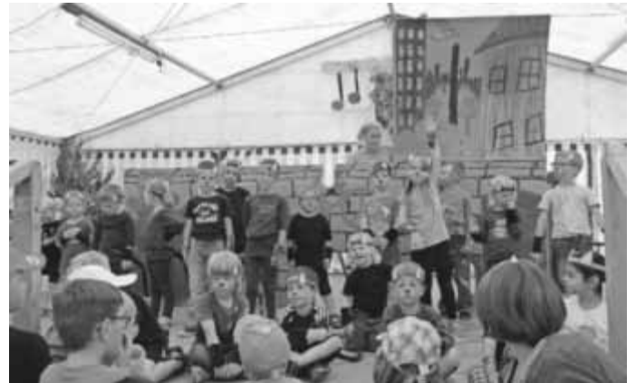
Kiga „Kleiner Drache“, Uigendorf Foto Ulrichsfest in Uigendorf

Wir wünschen schöne Sommerferien mit hoffentlich viel Sonnenschein!