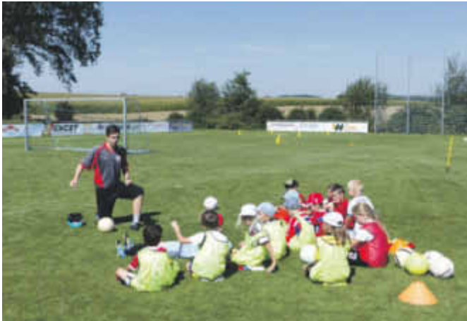
Aufmerksame Teilnehmer beim Camp im vergangenen Jahr

le KICK MIT das zweitägige Fußballcamp auf dem Sportgelände in Dietershausen durchführen. Termin ist der 27. und 28. August 2016. Bereits in den vergangenen Jahren hatten zahlreiche junge Kicker viel Spaß an diesem Fußballcamp mit der Fußballschule KICK MIT. Anmeldung ist ab sofort möglich mit dem Flyer der auf der Homepage der SF Bussen unter www.sf-bussen.de verlinkt ist. Auf dem Flyer findet man dann auch weitere Informationen rund um das Fußballcamp, wie z.B. die Teilnahmegebühr von 60 Euro, was in Anbetracht der zweitägigen Veranstaltung und der zahlreich enthaltenen Leistungen wie zwei warme Mittagssmahlzeiten, Getränke und Pausensnacks sowie Torschussgeschwindigkeitsmessung, Mini-WM oder Preise für die jeweiligen Sieger sicher ein Topangebot ist.