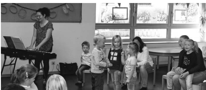
Singen macht Spaß - gemeinsames Singen mit Mama/ Papa noch viel mehr!