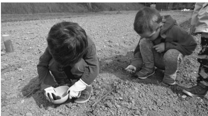
Wir säen Rüben und machen unsere Arbeit ganz genau!

Das Kindergartenteam mit Elternbeirat und Trägerschaft