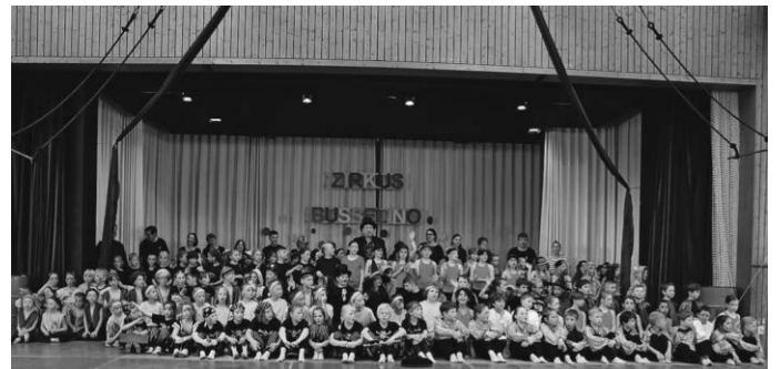
Schülerinnen und Schüler der Donau-Bussen-Schule mit dem Kollegium und Eltern beim großen Finale

Zwischen den Vorstellungen war für das leibliche Wohl mit einem Popcorn-Verkauf durch die Viertklässler und mehreren Food Trucks gesorgt. Gleichzeitig lud der Tag der offenen Tür zum Verweilen in den Klassenräumen ein, um einen Einblick in die Lebenswirklichkeit der Kinder fernab vom Zirkustrubel zu bekommen.