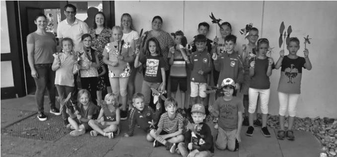
Die fleißigen Bastlerinnen und Bastler mit den Mitgliedern der Vorstandschaft des Schulvereins