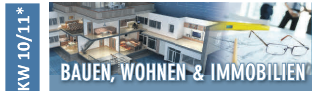
Ungerade KW*: in Pattonville

Veröffentlichen Sie jetzt Ihre Anzeige auf unseren Sonderseiten um Ihr Unternehmen werbewirksam zu präsentieren.