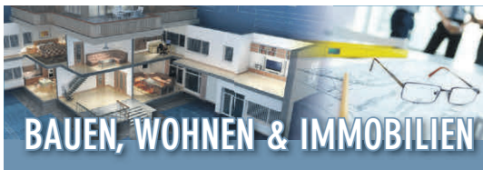
Ungerade KW*: in Pattonville