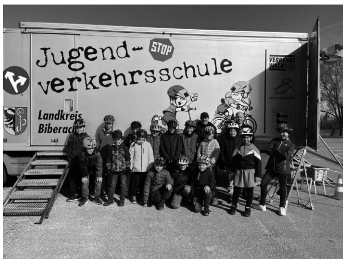
Schüler*innen der Klasse 4a mit ihren Ausbildern auf dem Verkehrsübungsplatz