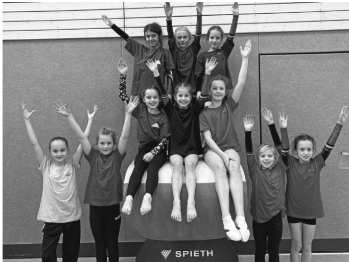
Die Teilnehmerinnen beim Kreisfinale