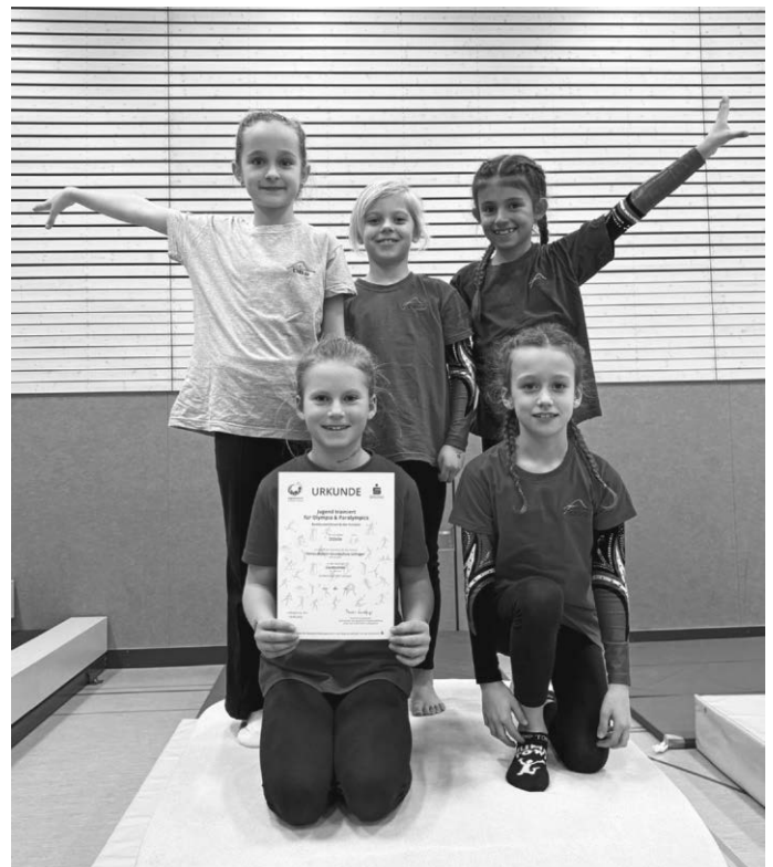
Die Teilnehmerinnen beim Regierungsbezirksfinale

Die Schulgemeinschaft gratuliert den jungen Sportlerinnen herzlich zu ihren tollen Leistungen bei den zwei Wettbewerben!