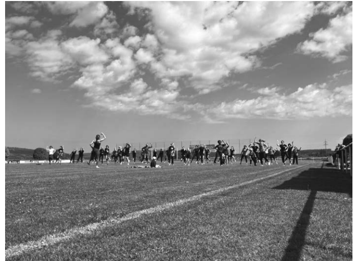
HIIT (High Intensity Interval Training) mit Eni Maier

Die SportConvention zeigte einmal mehr, wie viel Spaß gemeinsamer Sport machen kann – und machte Lust auf eine Wiederholung.